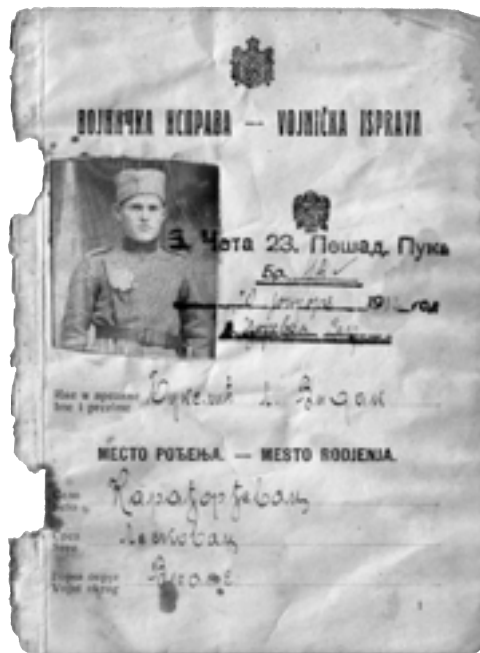
Војничка исправа („буквица“)