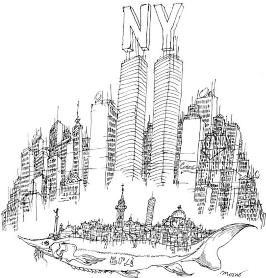
Београд у Њујорку, 1980