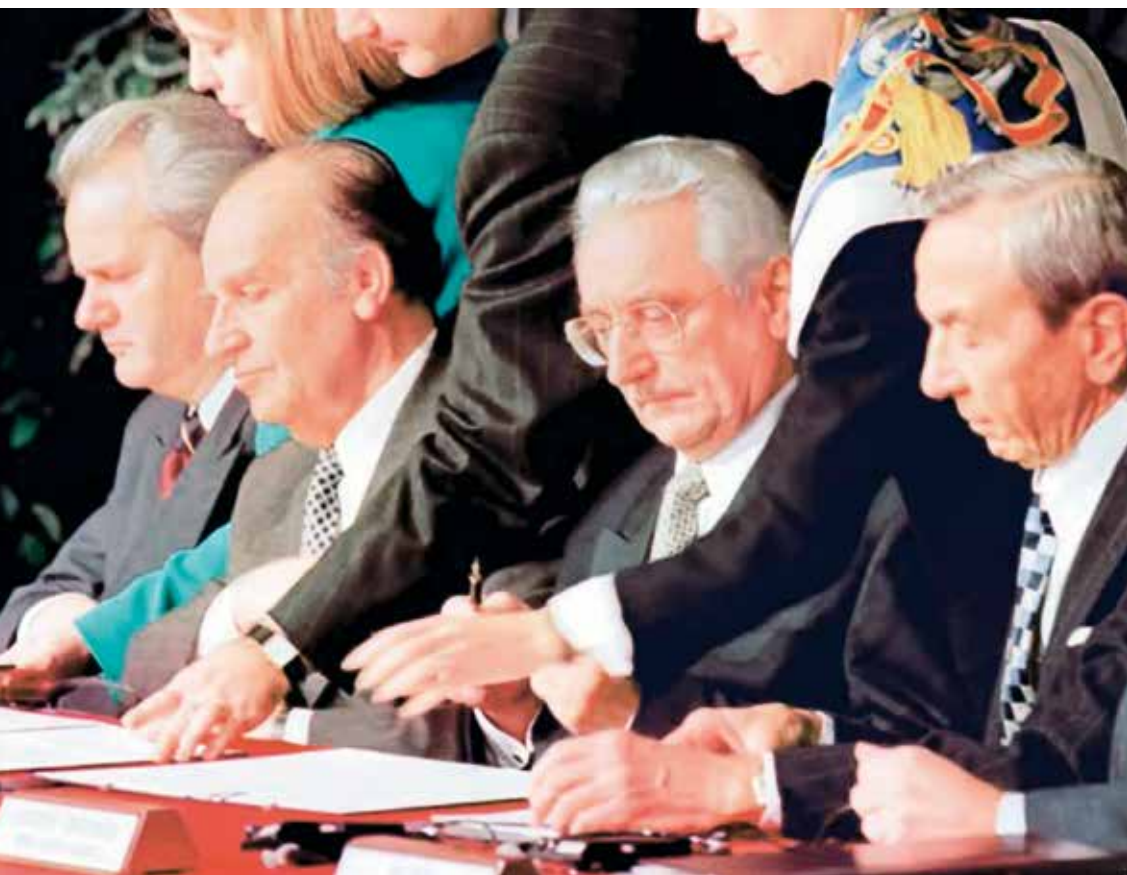
■ Potpis u Dejtonu: Milošević, Izetbegović, Tuđman i Kristofer

Moja uloga se vidi iz korespondencije sa Klintonom, ona više nije nikakva tajna. Najvažnije pismo je 3. oktobra 1995. Tu se vidi da je dejtonska konferencija bila moja ideja. Tu se vidi da je uspela moja najveća misija, zbog koje sam došao u Jugoslaviju i Srbiju - da donesem mir.