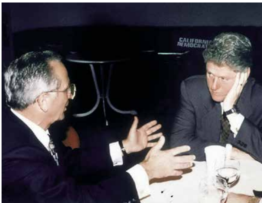
■ Milan Panić i Bil Klinton u razgovoru