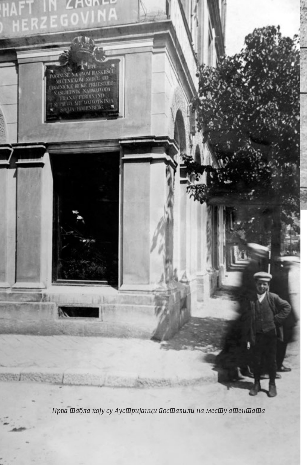
Прва табла коју су Аустријанци поставили на месту ашењиаја

BITE POGIBNE NA OVOJ BASKIŠĆU MUCENIČKOM SMISLU OD UBAVIČKE IZ NE PRJESTOLO NASLEJENIK NABRAJIVAMA FRANJO FERDINAND I SI PRIGVA ME VUVOVKINJA SOCIJA HOHENBERG