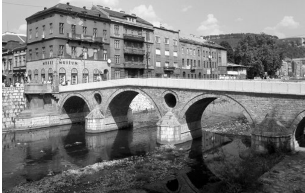
Лайпцишка ћуџрија - Принцијов мост - Фердинандова ћуџрија

То је за последицу имало крвав међунационални рат између Хрвата и Срба у Хрватској, и рат Срба, Хрвата и Муслимана у Босни и Херцеговини, који је почео као рат Хрвата и Муслимана против Срба, наставио се као рат Срба и Хрвата против Муслимана, да би се, на крају, испоставио као рат свих против свих, у миру који се претвара у дугорочни замрзнути конфликт.